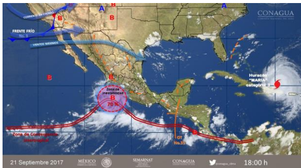
Imagen de satélite interpretada por el Servicio Meteorológico Nacional

Fecha de emisión: Viernes 22 de septiembre de 2017.